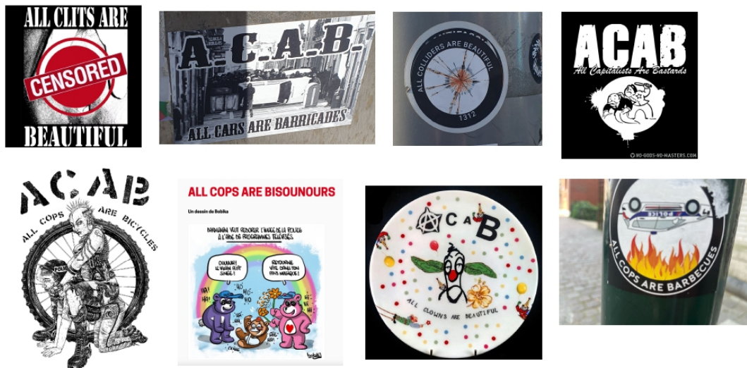
Figure 6 : Autres détournements de l'acronyme ACAB 55

l'oppression et les formes multiples de domination qui s'inscrivent dans « une perspective commune de libération ou d'abolition portée par un désir de transformation sociale » 54 .