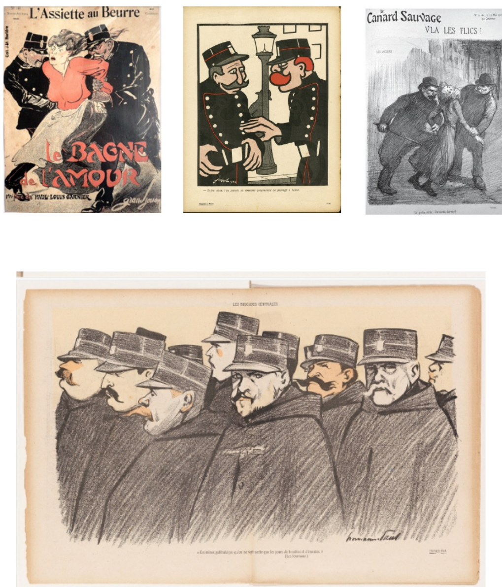
Figures 1. Caricatures : les policiers « bêtes et brutaux » dans les revues satiriques (début XXème siècle) 21

Au cours du temps, l'institution policière a bénéficié d'un changement d'image, grâce notamment à l'arrivée des fictions policières, qui vont anoblir le travail d'enquête, de diverses réformes visant à améliorer le recrutement, la sélection, la formation et la professionnalisation des policiers 22 , de la féminisation des personnels et des opérations de communication de la police elle-même autour de son image. Même dans le théâtre de Guignol, le gendarme que l'on devait à tout prix rosser, cesse « d'être un étranger hostile pour devenir un personnage familier » 23 . Cela ne suffira cependant pas à chasser l'image du « policier assurant