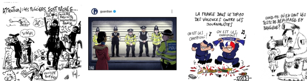
Figures 2. Caricatures : les policiers violents « assurant les basses œuvres du pouvoir » (revues satiriques et presse, deuxième moitié du XX ème siècle et début XXI ème siècle) 24

Mais à côté de la police qui fait peur et de la police qui fait rire, il y a aussi une police qui indigne 25 . Au tournant du millénaire, les critiques adressées à la police ne se limitent plus aux dénonciations ponctuelles de bavures ou aux représentations satiriques traditionnelles. On assiste à l'émergence d'une posture anti-police plus radicale, qui va plus loin dans la critique jusqu'à remettre en cause l'existence même de l'institution policière.