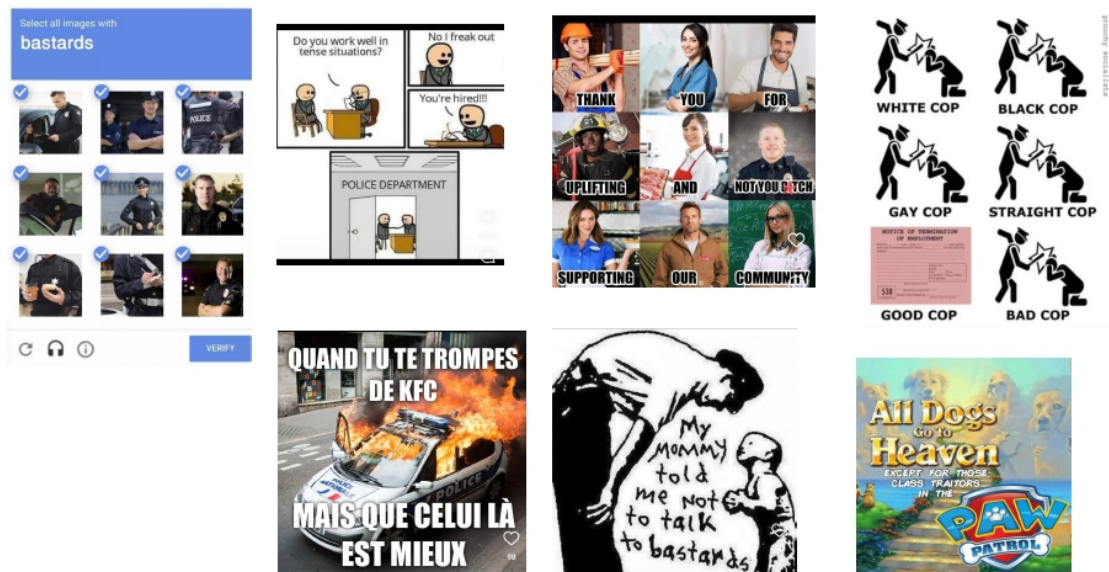
Figure 8. Occuper les murs numériques par la parodie et l'imitation : les mèmes 60