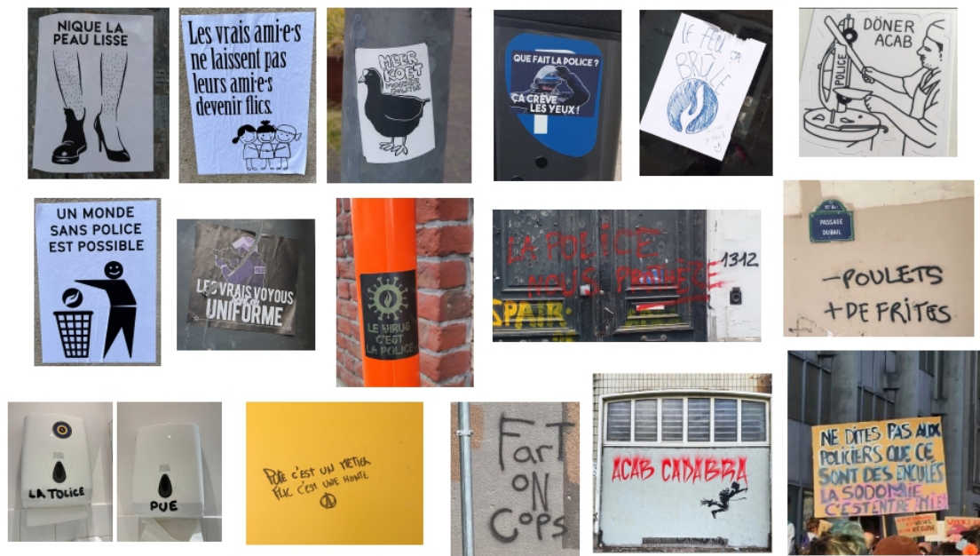
Figures 7. Occuper les murs réels : jeux de mots et renversement des symboles pour « foutre la honte » 59