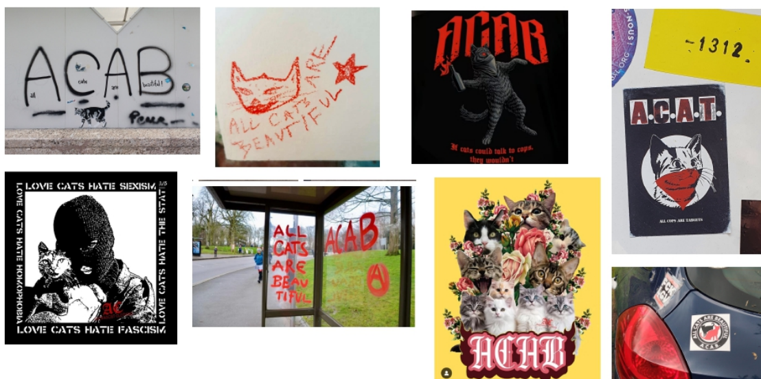
Figures 5 : All Cats Are Beautiful 49

Dans le corpus étudié, l’auteur souligne que 60 % des textes relèvent explicitement de cette critique. Par ailleurs, les publications les plus aimées et les plus retweetées appartiennent également à ce registre. Pour Fryer, il ne s’agit pas tant de masquer le lien entre cette formule et l’acronyme classique ACAB, que de souligner les valeurs communes qui traversent les différentes formes d’anti-autoritarisme. Le choix du chat comme figure centrale n’est pas anodin : cet animal est souvent représenté comme autonome, libre, indomptable et rétif à l’autorité, à l’inverse du chien, perçu comme obéissant et associé aux forces de l’ordre, comme le rappelle la blague selon laquelle « un chat ne travaillerait jamais pour la police, lui ». Cette figure du chat est d’ailleurs largement mobilisée dans les visuels et les publications issues des milieux antifascistes, anarchistes ou anticapitalistes 50 . Mais elle prend également une dimension genrée : le chat est souvent associé au féminin 51 , et plus particulièrement aux femmes indépendantes, vivant sans homme ; qu’il s’agisse de l’image de la sorcière, ou plus récemment, de celle de la femme célibataire et vieillissante, sans enfant ni mari, mais entourée de ses chats. Ces stéréotypes, utilisés comme stigmates, ont largement été réappropriés par les mouvements féministes comme deux figures d’empowerment et de renversement des normes patriarcales 52 .